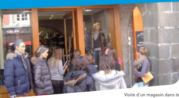
Visite d'un magasin dans le cadre du domaine « vente »