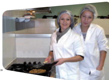
Cuisine en domaine « cadre de vie »