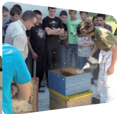
Visite chez un apiculteur