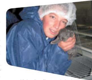
Visite d'un élevage de lapins

« Je suis arrivé en 4 e en 2001 et j'ai ensuite effectué toute ma scolarité au Lycée Les Vergers jusqu'en BTS ACSE. En 4 e et 3 e , j'ai pu faire mûrir mon projet professionnel, voir si je ne faisais pas fausse route. Et pour cela, les six semaines de stage sur les deux années m'ont apporté beaucoup. C'est un véritable privilège que n'ont pas les élèves qui suivent le cursus habituel ! La confrontation à des situations professionnelles est primordiale pour faire le bon choix. Les Modules de découverte professionnelle permettent également d'affiner notre projet professionnel. J'ai un très bon souvenir de ces années ! »