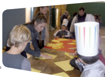
Pliage serviettes avec enfants

Au cours de la formation, j'effectue 18 semaines de stage (6 semaines/an) dans des structures d'accueil d'enfants, de personnes âgées, de personnes handicapées et dans des structures de tourisme et de territoire.