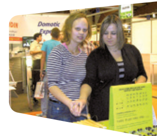
Visite salon Autonomic

Avant d'arriver aux Vergers, je voulais m'occuper d'enfants. Pendant mes années d'études, j'ai fait tous mes stages auprès des enfants, mon choix de métier s'est conforté, je voulais être auxiliaire puéricultrice. Après mon bac j'ai travaillé 1 an en gériatrie et j'ai passé mon concours d'auxiliaire puéricultrice à la Croix Rouge de Rennes. Après mes 10 mois de formation, j'ai travaillé dans les crèches collectives de Rennes. Puis, j'ai travaillé à la crèche Ty Bonhomme de Bonnemain. J'ai monté le projet de la microcrèche (tout en travaillant) pendant 2 ans avant de l'ouvrir le 29 octobre 2012.