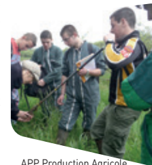
APP Production Agricole

Mon père est agriculteur et j'ai dès mon jeune âge aimé venir avec lui d'abord dans le tracteur puis ensuite auprès des animaux. En 3 ème j'ai fait mon stage dans le para agricole et j'ai découvert que le conseil technique auprès des éleveurs m'intéressait. J'avais hâte d'entrer dans un lycée agricole car je souhaitais déjà être en contact avec le domaine agricole tout en poursuivant mes études. Même si en 2 nde G et T on n'aborde pas directement les techniques agricoles, grâce à l'Atelier de Pratiques Professionnelles, j'ai commencé à étudier les cultures. En plus comme une semaine sur 2 nous avons « Aménagement », j'ai appris à tailler les arbres, d'ailleurs aujourd'hui je la pratique sur l'exploitation de mon père. En 2 nde G et T nous avons 2 semaines de stage et de nombreuses visites ainsi qu'une étude de milieu. Je suis satisfaite de ma 2 nde G et T car tout en suivant un enseignement général, on a approché le terrain et c'est ce que je recherchais