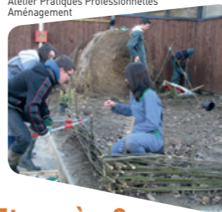
Atelier Pratiques Professionnelles Aménagement