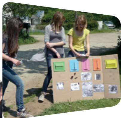
Etude de milieu

Le contact direct sur le terrain et les visites sont privilégiés pour atteindre ces différents objectifs.