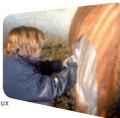
Soins aux chevaux

Au cours des 2 années de formation, je réalise 15 semaines de stage en milieu professionnel : 2 semaines en exploitation porcine, 8 semaines en organisme professionnel agricole en lien avec les productions animales (ferme expérimentale, Contrôle Laitier, Groupement de Défense Sanitaire .....), 1 mois en exploitation à l'étranger (Grande Bretagne, Irlande, Pays-Bas, Danemark, Canada ....) et 1 semaine en stage collectif dans le cadre du module d'enseignement «Élevage et Société».