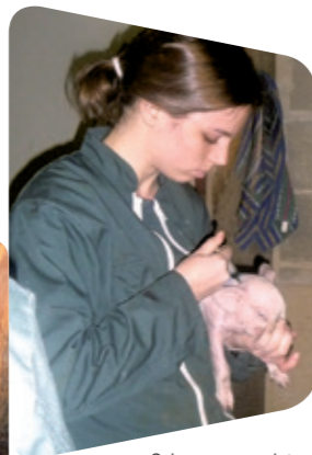
Soins aux porcelets